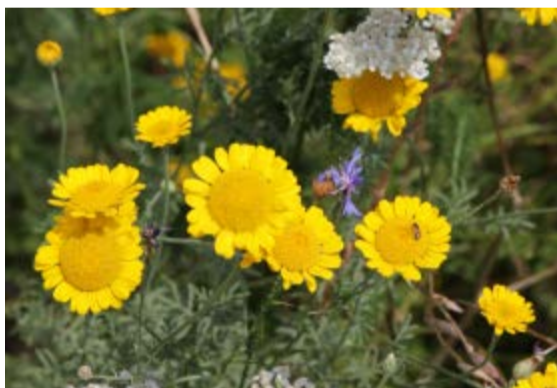
Gartenpflanzen setzen das ganze Jahr hindurch Akzente – und das über Generationen ...