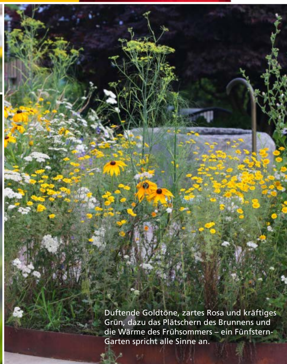
Duftende Goldtöne, zartes Rosa und kräftiges Grün, dazu das Plätschern des Brunnens und die Wärme des Frühsommers – ein Fünfstern- Garten spricht alle Sinne an.