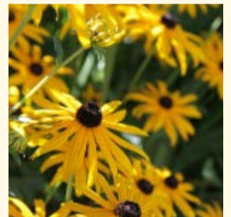
Gelber Sonnenhut Rudbeckia fulgida «Goldsturm»

Gelber Sonnenhut ist eine klassische mehrjährige Beetstaude, die in unseren Breitengraden sehr beliebt ist und oft verwendet wird. Ihre volle Blütenpracht erstrahlt ab Juni bis September, je nach Wetter etwas länger. Der Gelbe Sonnenhut benötigt nahrhafte Gartenerde und wächst an sonnigen und auch an halbschattigen Standorten. Sogar in Gefässen auf Terrassen und Balkonen fühlt sich der Gelbe Sonnenhut wohl. Die Blüten können problemlos geschnitten und für Sträusse verwendet werden.