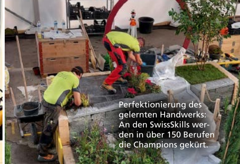
Perfektionierung des gelernten Handwerks: An den SwissSkills wer- den in über 150 Berufen die Champions gekürt.