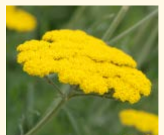
Schafgarbe gelblühend Achillea «Coronation Gold»

Schafgarbe gelblühend ist eine gelb blühende Art der Schafgarbe. Sie findet im Staudengarten in Kombination mit anderen Beetstauden ihren Platz. Die im Juni bis September blühende Art mit ca. 70 cm Wuchshöhe passt zu diversen Beetstauden. Die Schafgarbe bevorzugt einen sonnigen, nicht zu trockenen bis frischen Standort. Sie kann auch als Schnittstaude verwendet werden und bietet heimischen Insekten Lebensraum.