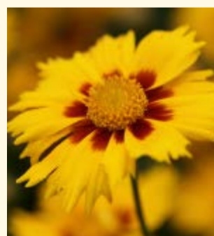
Sonnenbraut Helenium autumnale

Sonnenbraut gibt es in zahlreichen Sorten. Mit ihren kräftigen goldgelb-rot leuchtenden Farbkombinationen findet diese Staude in so manchem Staudenbeet ihren Platz. Durch die eher etwas spätere Blütezeit (Juli–September) ergibt sich ein prächtiges wechselndes Farbenspiel. Die Sonnenbraut bevorzugt nahrhaften frischen Gartenboden an sonnigem Standort und kann auch als Schnittstaude für Sträusse verwendet werden. Sie dient Bienen und anderen Insekten als Futterpflanze.