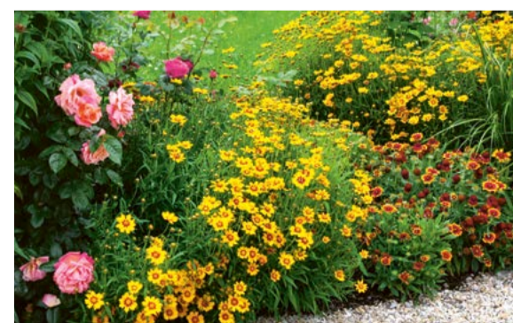
Eine duftende, farbige Blütenpracht, die richtige Mischung von standortgerechten Pflanzen sowie eine ausgewogene Artenvielfalt machen Ihren Garten zu Ihrem idealen Rückzugsort vor dem Alltag.