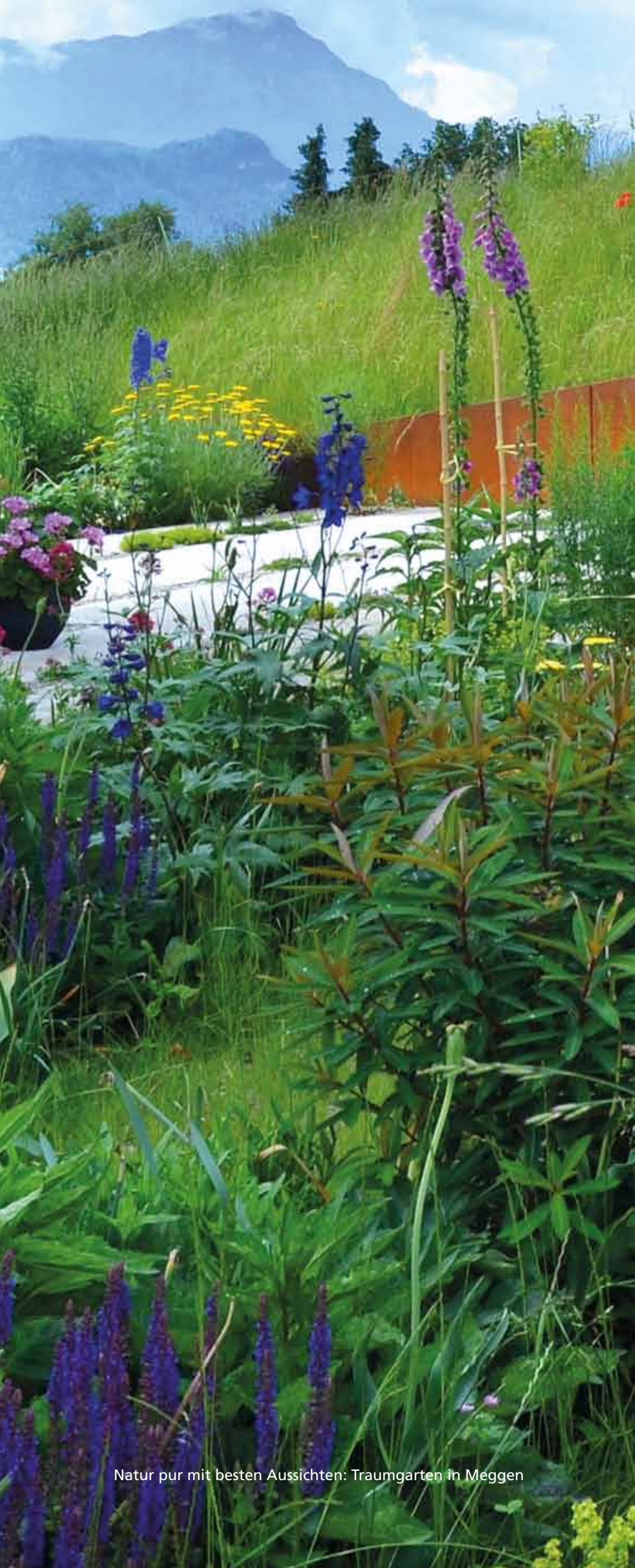
Natur pur mit besten Aussichten: Traumgarten in Meggen