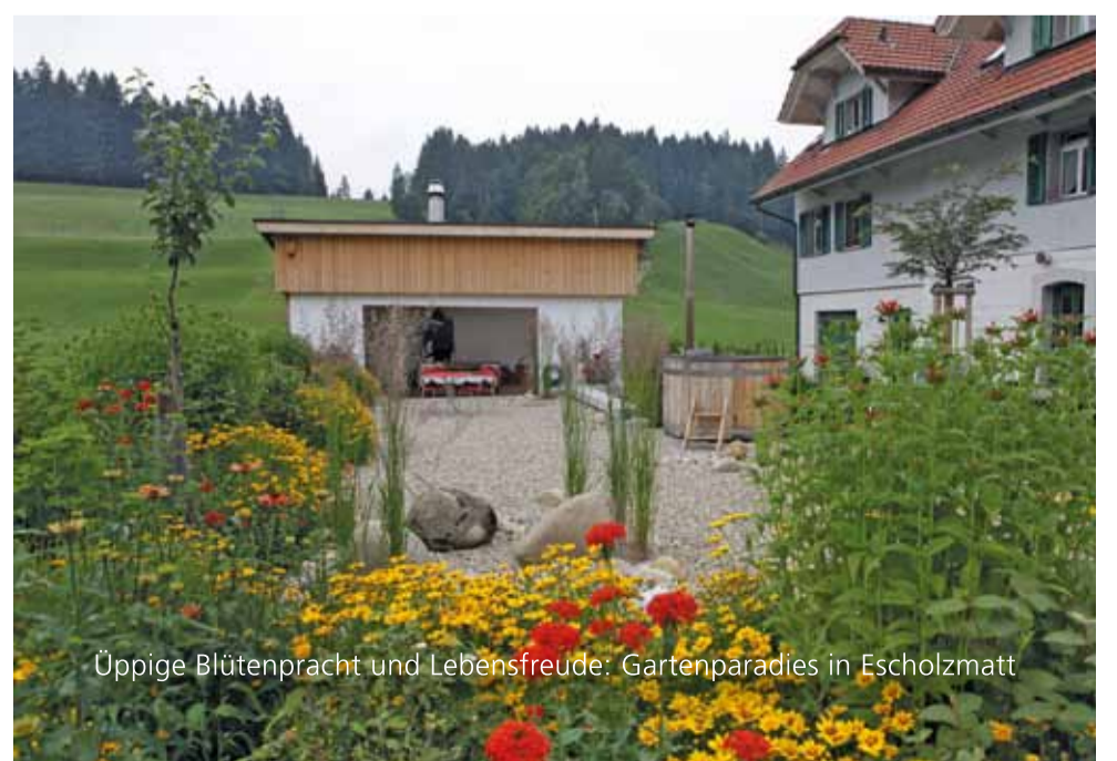
Üppige Blütenpracht und Lebensfreude: Gartenparadies in Escholzmatt