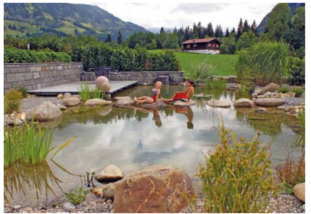
Entspannung à discretion: Naturnahe Teichanlage in Flühli