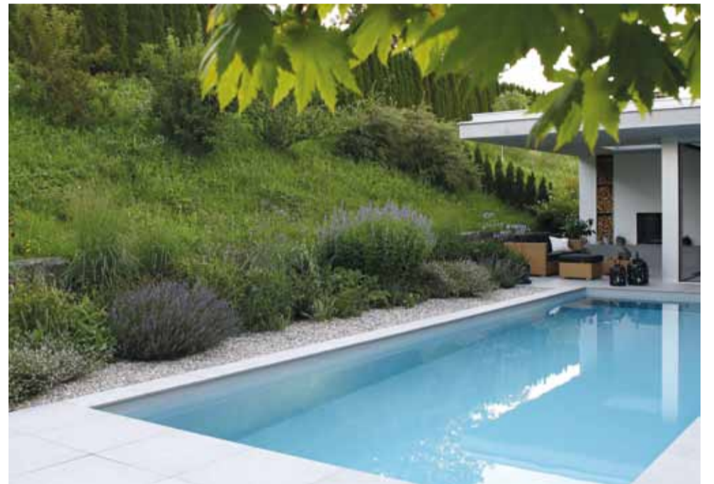
Viel Spielraum auf begrenzter Fläche: Terrassengarten in Kastanienbaum