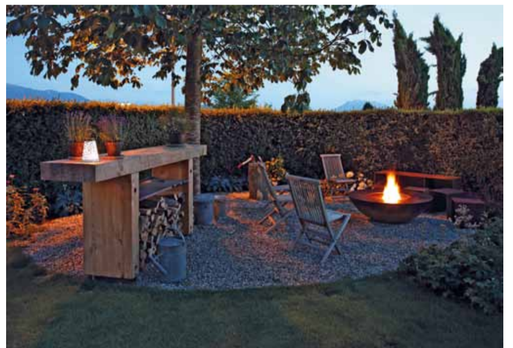
Stimmungsvolle Oase in Hünenberg: Genuss für alle Sinne